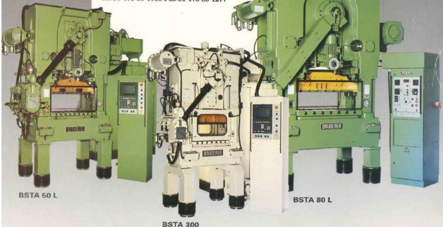
BSTA 50 L