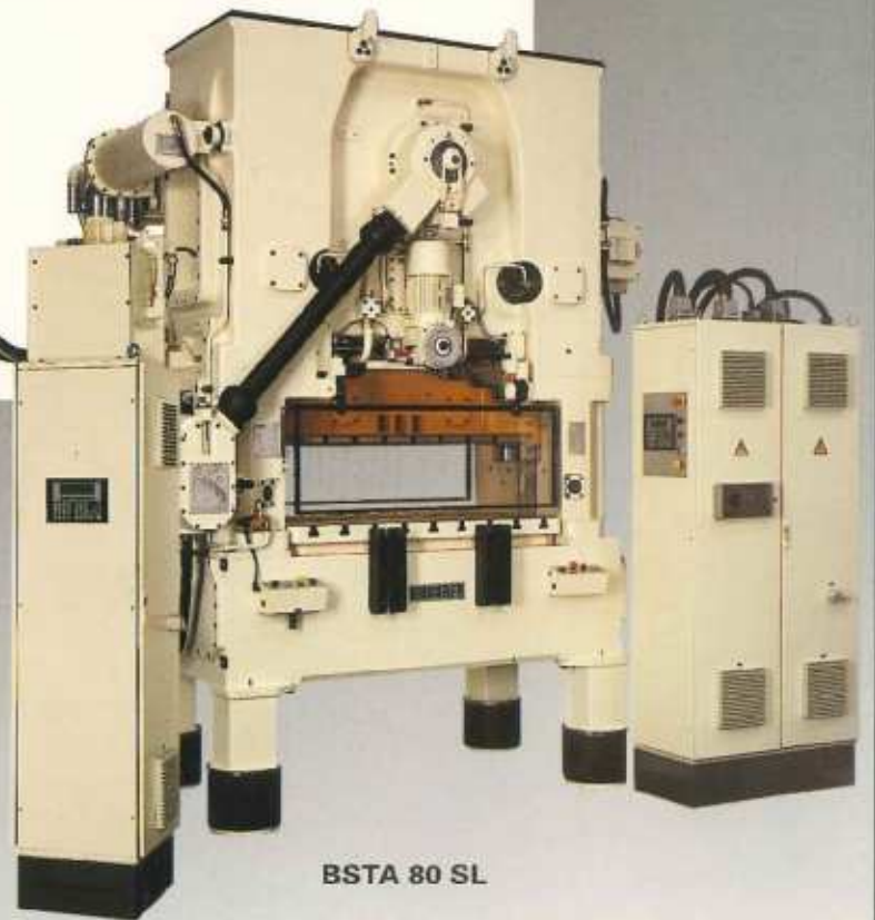
BSTA 80 SL